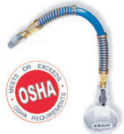
모델 1100-9312 슈퍼에어노즐 원편 설명을 참조하십시오.