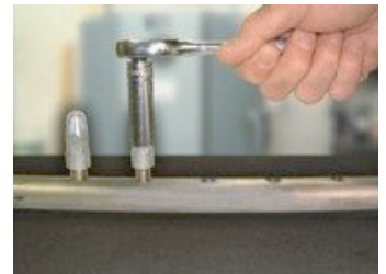
EXAIR사의 에어노즐은 Eox Wrench 또는 Socket Wrench로 쉽게 조일 수 있다.