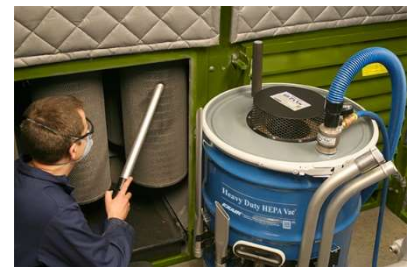
막힌 버핑 부스 필터 시스템은 산업용 HEPA급 진공 시스템을 사용하여 신속하게 청소한 후 다시 사용할 수 있습니다.

EXAIR의 압축공기 구동 방식 산업용 HEPA급 진공 시스템은 일반적인 30, 55 또는 110갤런 오픈 드럼에 장착하여 강력한 HEPA (고효율 미립자 공기) 등급 산업용 진공 청소기로 사용할 수 있습니다. 헤비 듀티 드라이 백과 마찬가지로 더 많은 이물질을 적은 마모로 처리할 수 있도록 강력하게 설계되었습니다. 또한 산업용 HEPA급 진공 시스템은 분진이 많은 환경에서 빈번한 청소 작업을 수행하면서도 HEPA 기준에 맞춰 오염물을 필터링할 수 있도록 설계되었습니다.