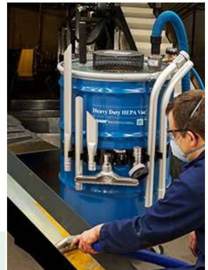
기술자는 산업용 HEPA급 진공 시스템을 사용하여 분쇄기의 정기 유지보수를 수행합니다.

이 제품은 정기적인 청소가 필요한 분진 환경을 위해 고용량 필터 구조로 설계되었습니다. 일반 진공 청소기는 많은 분진이나 입자가 존재하는 환경에서 빠르게 막히는 경우가 많습니다. 경제적이며 유지보수가 쉬운 프리필터는 큰 입자의 이물질을 차단하고, HEPA 필터는 미세 입자를 처리합니다. EXAIR의 모든 필터는 HEPA 기준 충족을 위해 0.3마이크론 입자 기준 최소 99.97% 여과 성능을 만족하도록 IEST-RP-CC-007 규격에 따라 100% 테스트됩니다. HEPA 필터 수명을 연장하기 위한 선택형 필터 보호 커버도 제공됩니다. 산업용 HEPA급 진공 시스템은 전기를 사용하지 않으며 구동 부품이 없어 유지보수가 거의 필요하지 않습니다. 또한 전기식 산업용 진공 청소기에서 발생할 수 있는 감전 위험도 제거할 수 있습니다. 정전기 방지 호스는 건조하고 분진이 많은 물질을 청소할 때 발생할 수 있는 불쾌한 정전기 충격을 방지합니다.